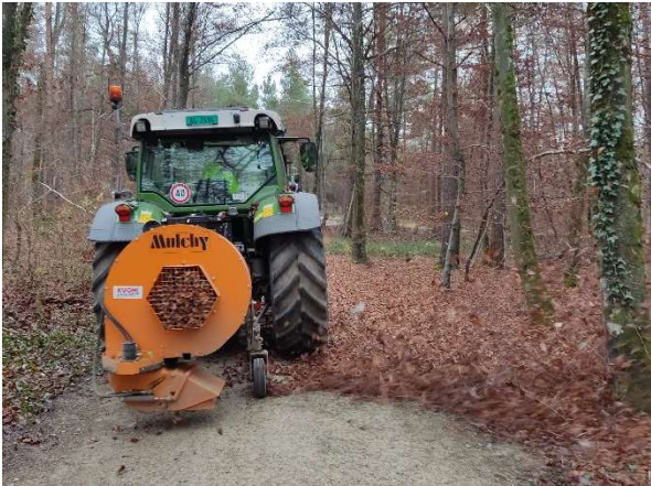
Laubbläser in Densbüren im Einsatz (WaldAargau)