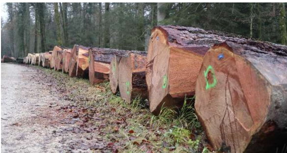
Wertholzlagerplatz Riniken (WaldAargau)

Der durchschnittliche Erlös stieg wieder auf CHF 468.00 pro Fm. Alle Hauptbaumarten wie Fichte (305.00 CHF/Fm), Lärche (859.00 CHF/Fm), Douglasie (407.00 CHF/Fm), Buche (186.00 CHF/Fm), Eiche (582.00 CHF/Fm) und Esche (227.00 CHF/Fm) haben sich preislich positiv entwickelt. Diese Ergebnisse lassen auf eine gute zweite Submission im März 2022 hoffen.